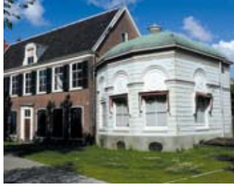
Tuinkoepel Bellevue en Vredenburg 2012