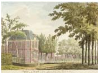
Uit den Bosch door Hendrik Tavenier in 1783 (NHA)