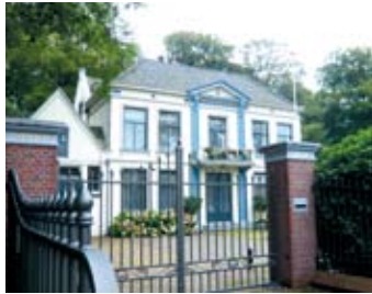
Zomerlust 2012