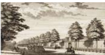
Spruitenbosch door Hendrik de Leth 1732 (NHA)