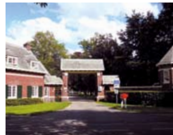
Spaar en Hout 2012