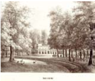
Dreefzicht rond 1840, getekend door P.J. Lutgers (NHA)