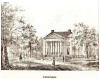
Eindhoven door P.J. Lutgers 1840 (NHA)