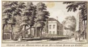
Bosch en Vaart door Hendrik Spillman 1759 (NHA)