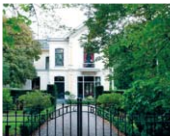
Spruitenbosch 2012