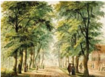
Latere Koningin Wilhelminalaan in 1767 door H. Keun