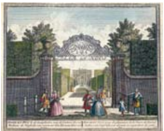
Spaar en Hout door Hendrik de Leth 1732

Weer terug richting de Haarlemmerhout houden wij rechts aan. Achter de huizen aan de noordkant van de Oosterhoutlaan ligt nog de oude oprijlaan tussen Oosterhout en de Hout. Het terrein rechts behoort bij Spaar en Hout .