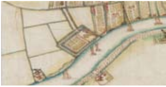
Oosterhout op een detail v.d. kaart van B.F. van Berckenrode uit 1643 (NHA)