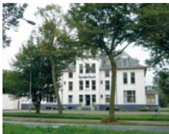
Uit den Bosch 2012

De plek van het vroegere buitenhuis, afgebroken in 1930, bevindt zich rond Wagenweg 164. Aan de Zomerluststraat nummer 4 staat nog het vroegere koetshuis, inmiddels woonhuis (optioneel).