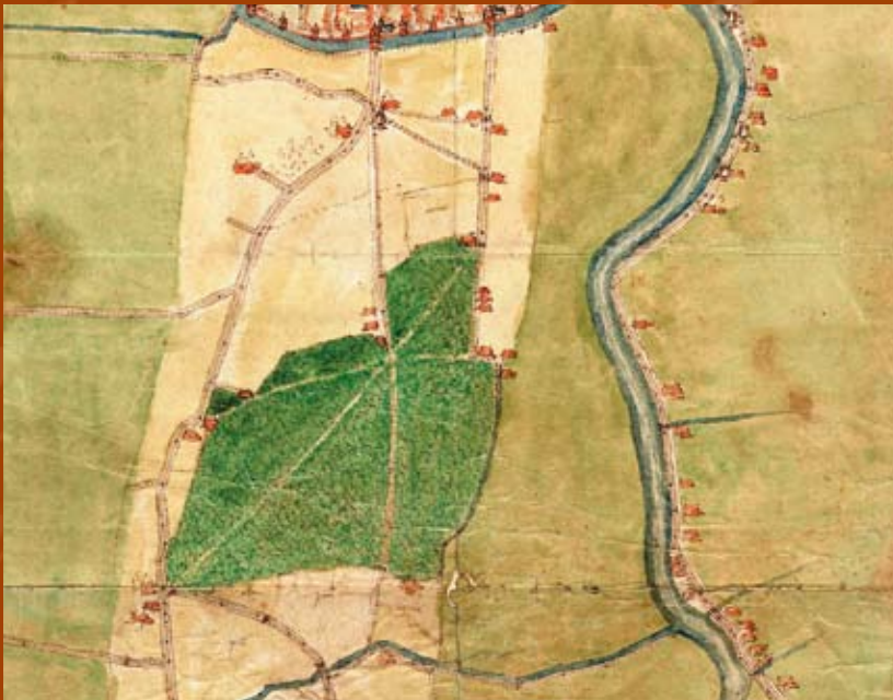
Detail uit de kaart van Jacob van Deventer 1560 (NHA)

Eind negentiende, begin twintigste eeuw werden veel buitenplaatsen afgebroken en ontstonden de villaparken die wij op onze wandeling zullen tegenkomen naast wat nog rest van de buitenplaatsen.