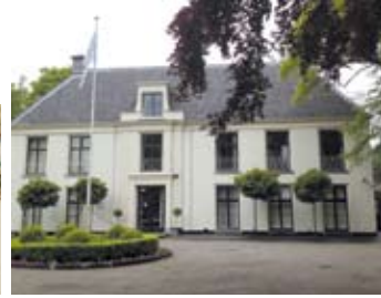
Oosterhout in 2012