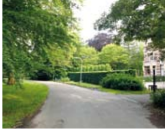
Koningin Wilhelminalaan 2012