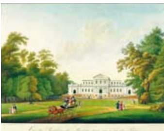
Welgelegen door F.C. Bierweiler rond 1800 (NHA)

De omliggende huizen, zoals ‘Lindenhoek’ en de rij huizen naast het Paviljoen Welgelegen (tegenwoordig het onderkomen van de Provinciale Staten van Noord-Holland), dateren allemaal van eind negentiende eeuw. Zij vervingen buitenplaatsen met prachtige namen als Houtvreugd, Houtvrede, Houtzigt en Middenhout.